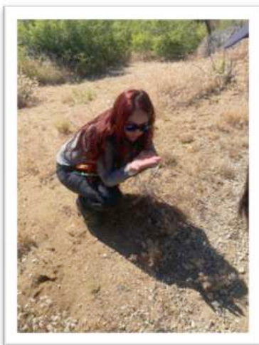
Bestimmung von Cryptantha

Bei dieser Tour ging es in die Nähe der Mormon Rocks. In zwei Teams sammelten wir Saatgut von Salvia hispanica , Calochortus plummerae , Chaenactis und Phacelia . Stecklinge schnitten wir von Artemisia tridentata , Lupinus und Eriogonum fasciculatum .