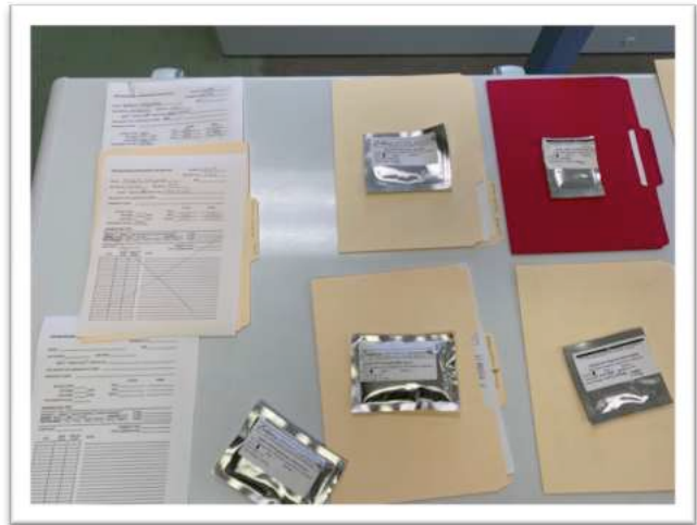
Saatgutentnahme aus dem Tiefkühler