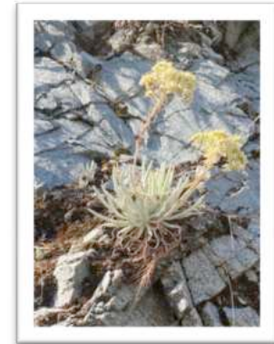
Habitat von Duddleya densiflorum

Weiter ging es nun in die San Bernardino Mountains zu den Mormon Rocks. Schon weit vor Ankunft, konnte man die schweren Waldbrände erkennen. Unsere Aufgabe bestand darin, Blätter von Zeltnera venusta zu sammeln. Wir liefen ca. 2km durch ein ausgetrocknetes Bachbett und konnten eine größere Population finden. Die meisten Pflanzen waren schon abgängig, allerdings konnten wir genügend grünes Material entdecken.