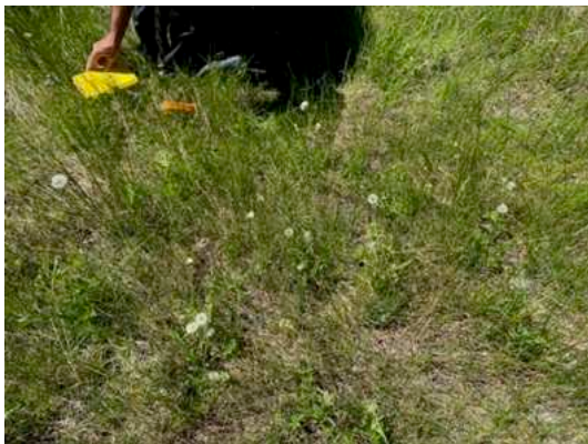
Taraxacum californicum (ca. 40% Reinheit)

Nach einer einstündigen Fahrt kamen wir zum Big Bear Lake. Unsere nächste Aufgabe war das Auffinden von Taraxacum californicum . Die Pflanze hat den zweithöchsten Schutzstatus in Kalifornien 1.B1. Sie ist von weniger als 40 Standorten bekannt. Der natürliche Lebensraum sind feuchte Bergwiesen zwischen 1675m – 2590m in den San Bernardino Mountains. Anhand von 40 Jahre alten GPS-Koordinaten gingen wir auf die Suche, konnten allerdings keine Pflanzen entdecken. Nun ging es weiter in die Big Bear City. Auf einer Feuchtwiese, innerhalb eines Wohngebietes, konnten wir einige Pflanzen finden, die Ähnlichkeiten mit der Art californicum aufwiesen. Hiervon sammelten wir einige Blätter für spätere DNA-Analysen. Das Verschwinden der Art ist auf genetische Verschmutzung zurückzuführen. Taraxacum californicum hybridisiert mit Taraxacum sect. Ruderalia und letztere Art wird sich langfristig durchsetzen.