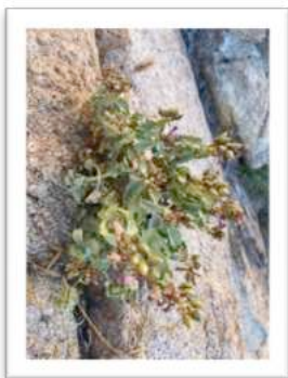
Penstemon clevelandii var. mohavensis

Bei unserem ersten Halt des Tages gingen wir auf die Suche von Penstemon clevelandii var. mohavensis . Wir wanderten ein kurzes Stück auf einem steilen und steinigem Pfad. Nach ca. einer halben Stunde fanden wir, dank GPS-Koordinaten, eine Population auf einem Felskopf. Wir waren allerdings ca. 3 Wochen zu früh, die Fruchtstände waren noch nicht ausgereift, somit mussten wir den Rückweg ohne Saatgut antreten.