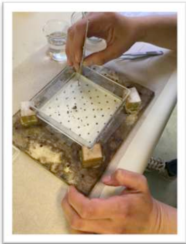
Keimversuch in Agar