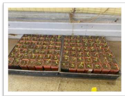
Asclepias fascicularis in 2" Töpfen