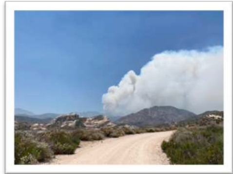
Waldbrände San Bernardino Mountains