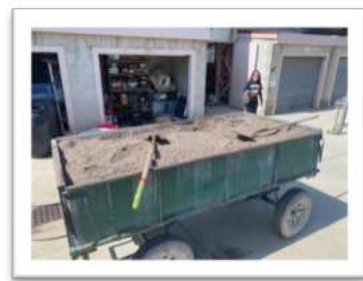
Dämpfen von Topfsubstrat