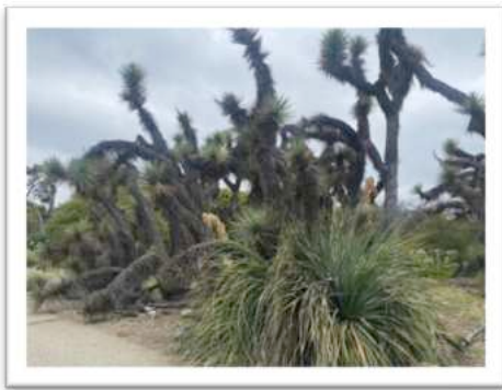
Joshua Tree Woodland

Mechanische Unkrautbekämpfung mit Hilfe von Volunteers