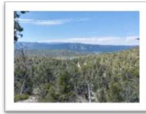
Blick auf den Big Bear Lake