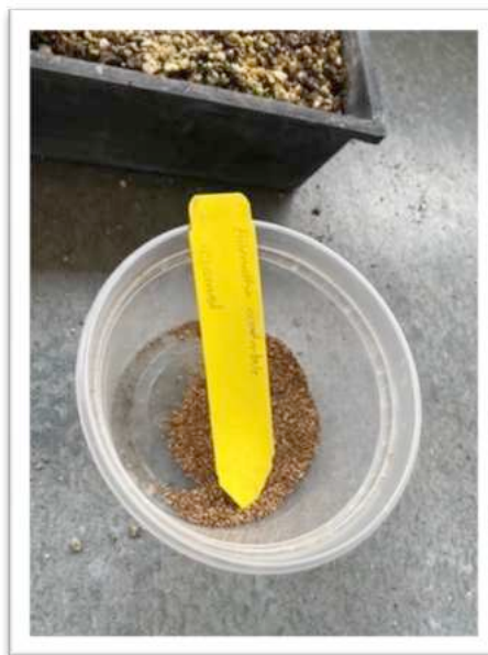
Aussaat Allenrolfea occidentalis