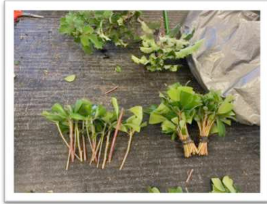
Stecklinge v. Comarostaphylis diversifolia ssp. planifolia

Nach unserer Einweisung in die Hygienevorschriften ging es nun endlich an den Arbeitsplatz. Als Erstes wurde Allenrolfea occidentalis in D8'er Treetubes ausgesät. Eine Gitterplatte trägt 50 Töpfe. Zuvor wurden sie mit einem Salton-Substrat befüllt. Pro Topf säte ich ca. 5 Körnchen. Abschließend wurde mit einem 1,6mm Quarz-Silikat Sand leicht abgedeckt. Die salzliebenden Pflanzen wurden vor dem Ausstellen mit Salzwasser angegossen. Insgesamt ein erfolgreicher erster Arbeitstag.