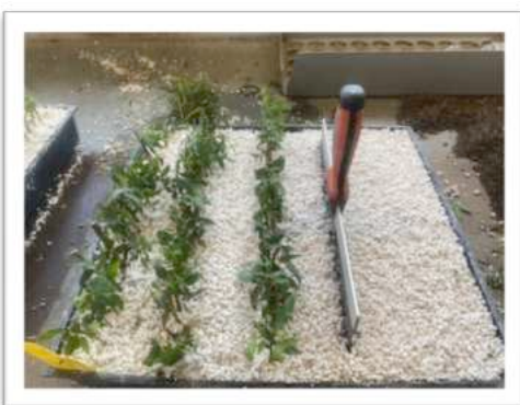
Stecklinge von Berberis nevini