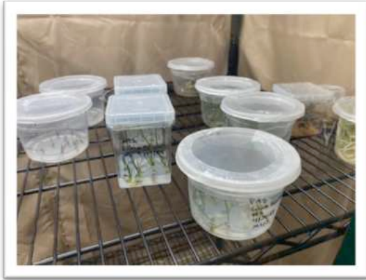
Lilium humboldtii in Agar