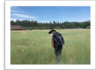
Suche von Poa atropurpurea