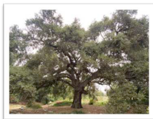
Quercus agrifolia var. agrifolia