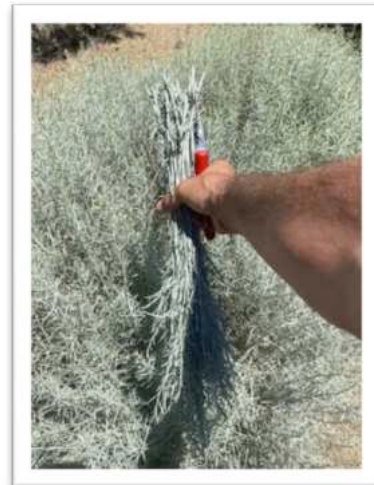
Stecklinge von Artemisia tridentata