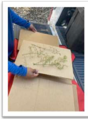
Sammeln von Herbarbelegen