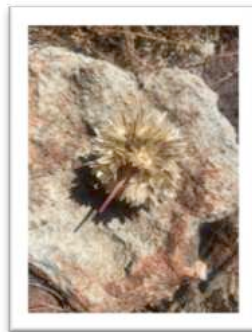
Saatgut Allium shevockii