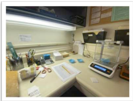
Arbeitsplatz in der Samenbank

Pro Bestellung wird eine Grundgebühr von 30\$ + 10\$/\text{Akzession} erhoben. Dies erschien mir zu Beginn etwas hoch. Nachdem ich den Prozess der Saatgutentnahme und Ausinventarisierung, für mein gewünschtes Saatgut, selbst durchführen konnte, habe ich meine Meinung schnell revidiert. Insbesondere die Buchführung (Saatkörner zählen und abwägen, Formulare u.a.) hat sehr viel Zeit in Anspruch genommen.