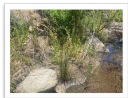
Habitat von Zeltnera venusta