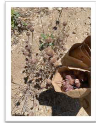
Saatgut von Chia