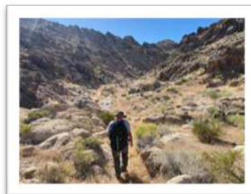
Wüste, San Bernardino County