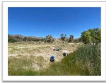
Sammeln von DNA-Material