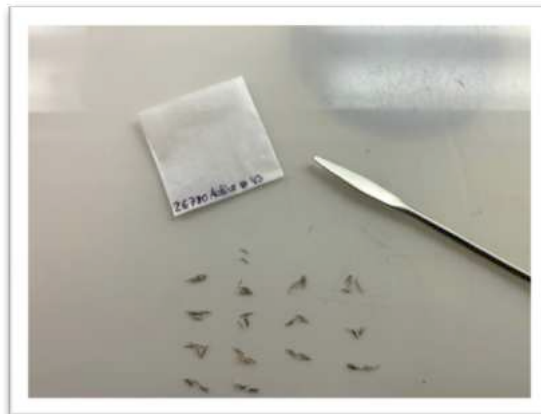
Zählen von Saatgut zwecks Einlagerung

Neu eingetroffenes Saatgut wird zuerst getrocknet und später in der Reinigungskammer gesäubert. Zu diesem Zweck stehen klassische Siebe sowie ein Saugreiniger zur Verfügung. Anschließend wird das Saatgut, bei kleineren Mengen, in metallbeschichteten Frischhaltebeuteln eingeschweißt. Größere Mengen gelangen in Kunststoffdosen in die Tiefkühlung. Von jeder neuen Akzession wird nun ein Keimfähigkeitstest durchgeführt.