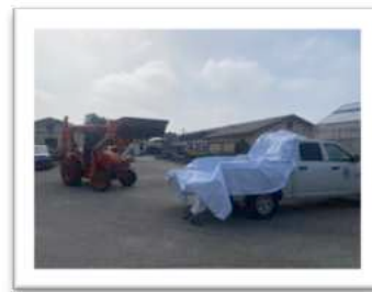
Substrat für US Forest Service