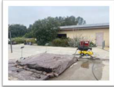
Dämpfen von Containern

Das Sterilisieren von Arbeitsmaterialien und Substraten gehörte zu einer meiner häufigeren Tätigkeiten in der Gärtnerei. Der Prozess war beendet, wenn jeder der vier Temperaturmesser, mindestens 60°C anzeigte.