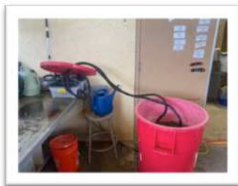
Portabler Wagner Dämpfer