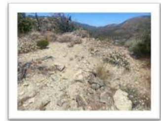
Lebensraum von Allium shevockii