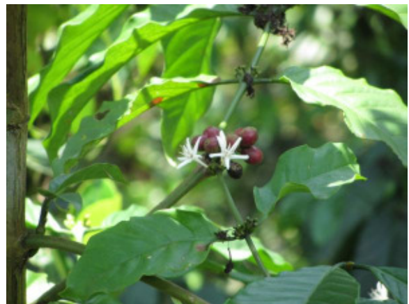
Coffea arabica : Blüten und Früchte

Auf Bali wird Coffea arabica in zwei verschiedenen Qualitäten angebaut: Export-Kaffee und Bali-Kopi. Der Export-Kaffee wird laut meinem Guide in „hellen“ Boden gepflanzt. Die Bäume wachsen schnell und tragen dreimal im Jahr große Früchte. Dieser Kaffee gilt unter den gläubigen Einheimischen als minderwertig und wird nicht getrunken. Der Bali-Kopi hingegen wird in „dunklen“ Boden gepflanzt. Er wächst deutlich langsamer und trägt nur einmal im Jahr sehr kleine