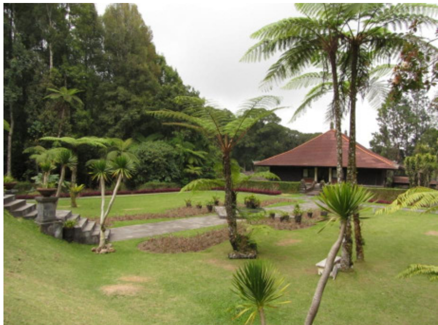
Verwaltungsgebäude im Botanischen Garten Bedugul

genutzt. Die Pflanzen sind alle mit indonesischem und botanischem Namen beschriftet und teilweise gibt es Tafeln über deren Verwendung. Der botanische Garten ist gepflegt, gut beschildert und übersichtlich. Um alles in Ruhe betrachtet zu können, sollte man aufgrund der Größe und Vielfalt einen ganzen Tag für den Besuch einplanen. Der Eintritt beträgt ca. zwei Euro.