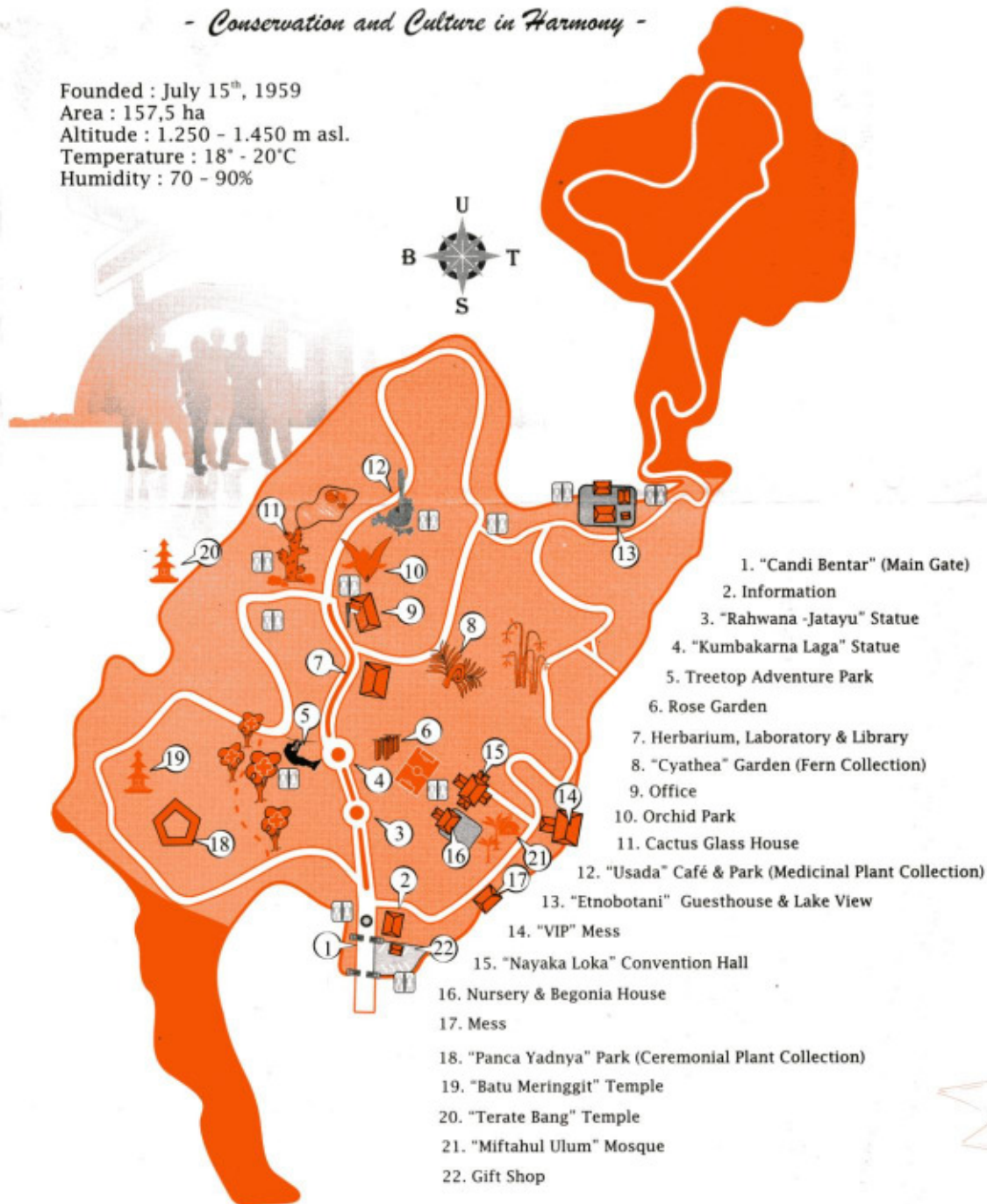
Botanischer Garten Bedugul

Founded : July 15 th , 1959 Area : 157,5 ha Altitude : 1.250 - 1.450 m asl. Temperature : 18° - 20°C Humidity : 70 - 90%