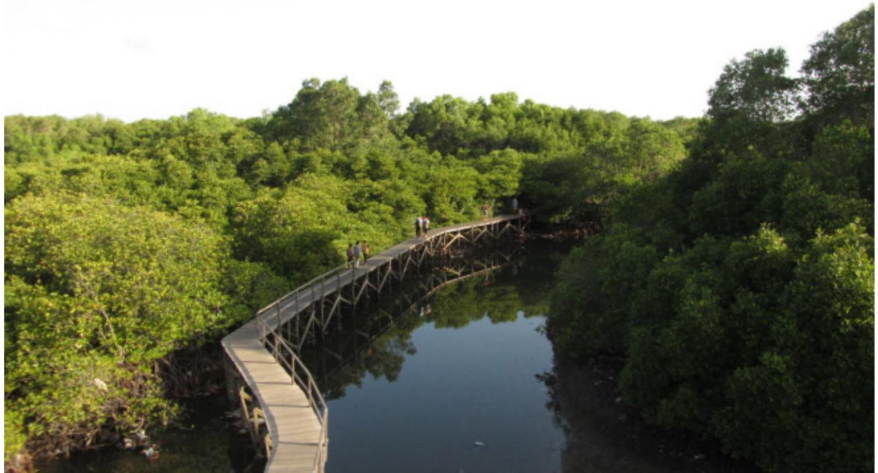
Rundweg im Mangrove-Information-Center

Im Süden der Insel in der Nähe der Hauptstadt Denpasar befindet sich das Mangrove Information Center. Ziel der Stiftung ist, es den Touristen und vor allem den Einwohnern der Insel die Vielzahl und Wichtigkeit von Mangroven nahe zu bringen. Hierfür wurde ein großes Ufergebiet unter Schutz gestellt. Die Mangroven werden nicht nur geschützt, sondern auch vermehrt und gepflanzt. Deshalb sind hier mittlerweile 18 Arten zu finden. Es gibt einen 2km langen Rundweg über ein System von Stegen.