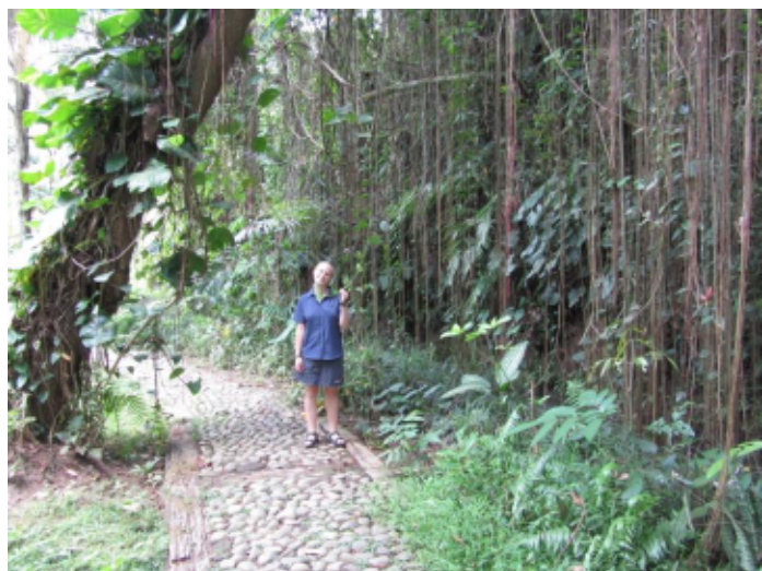
Im Botanischen Garten Ubud

ungenauen Karte, die mir am Eingang überreicht wurde, sind die Wege schlecht beschrieben und überwuchert. Ich stellte mir manchmal die Frage, ob ich noch auf einem der Wege bin oder nicht und schaffte es daher auch mich ein wenig „zu verlaufen“. Sehr schade war es auch, dass der größte Teil der Pflanzen nicht beschriftet war. Mit ein bisschen mehr Ordnung und Organisation könnte es ein schöner botanischer Garten in einer natürlichen Umgebung werden. Der Eintritt beträgt ca. fünf Euro.