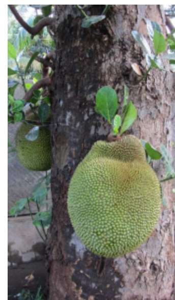
Jackfrucht am Baum

Pflanzen in ihrer natürlichen Umgebung zu sehen veränderte meine Sichtweise bei der Pflege. Wenn man einmal die Originalbedingungen der Tropen kennengelernt hat, merkt man erst einmal, wie Temperatur und Luftfeuchtigkeit auf einen Organismus wirken. Es ist durchaus etwas anderes mit der Orchidee zu schwitzen, als sie zu besprühen. Außerdem ist es schön zu beobachten, wie die Pflanzen in ihrem natürlichen Lebensraum wachsen. Orchideen ohne Halterungen, Bäume, die nicht beschnitten werden müssen, weil sie sonst die Kuppel des Gewächshauses sprengen, oder Papaya- oder Kakaobäume, die einfach mitten im Wald auftauchen. Ich würde jedem empfehlen, die Pflanzen, mit denen er arbeitet, zu „besuchen“ um sie genauer zu verstehen. Und in diesem Sinne möchte ich der Stiftung Internationaler Gärtneraustausch sehr herzlich für ihre Unterstützung danken.