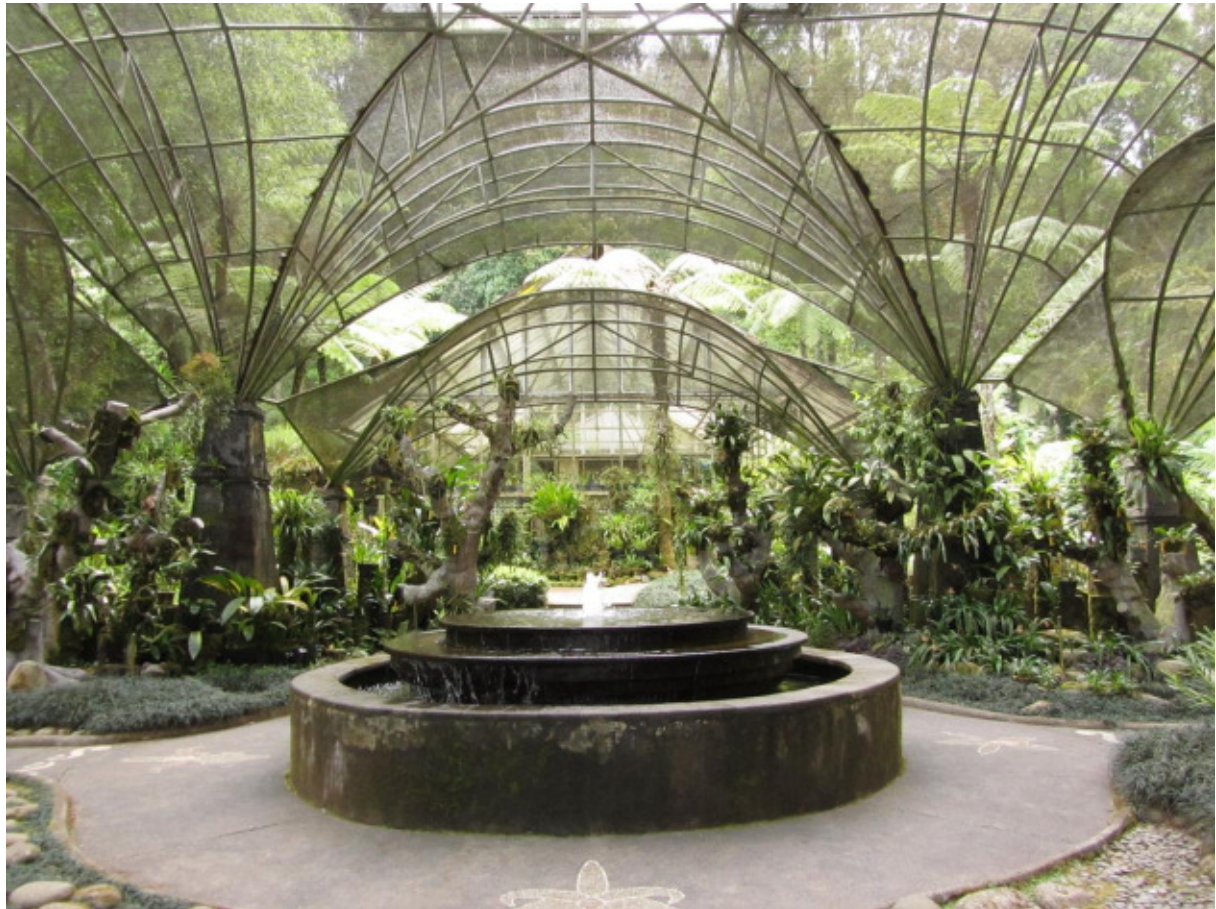
Halle einheimischer Pflanzen im Botanischen Garten Bedugul

Der botanische Garten in Bedugul wurde bereits 1959 gegründet. Aufgrund seiner Größe von 157,5 ha kommt er einem Städtchen gleich und kann mit dem Auto befahren werden. Er liegt mit einer Höhe von 1250-1450 m deutlich höher als der botanische Garten in Ubud.