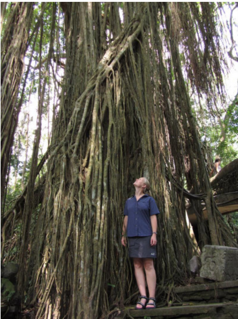
Ficus im Monkey Forest

Die Region Ubud ist durchaus eine Reise wert. Von hier können viele Ausflüge unternommen