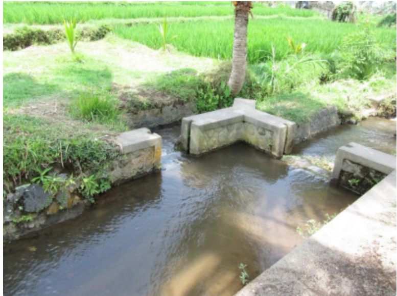
Wehr zur Verteilung des Wassers auf die einzelnen Reisfelder

Bali noch der teurere Bali-Reis angebaut. Dieser braucht 150 Tage vom Einpflanzen bis zur Ernte. Die Reisfelder Balis werden alle mit Wasser aus den höher gelegenen Vulkanseen bewässert, so dass keine Pumpen notwendig sind. Hierfür wurden Gräben mit kleinen Wehren gebaut, um den Wasserfluss zu regulieren. Damit jedem Bauern die gleiche Menge Wasser zukommt, wurde die „seka subak“ (Reisgemeinschaft) eingeführt. Sie verpflichten sich, die Regeln für den hinduistisch geprägten Reisanbau einzuhalten. Dies bedeutet, in Einklang mit den Göttern, der Natur und ihren Mitmenschen zu leben, sich zu unterstützen und andere Bauern nicht zu bestehen. Zur Besänftigung der Reisgöttin Siri sind auf jedem der Felder kleine Schreine aufgebaut. Zudem befinden sich häufig Tempel in der Nähe der Reisfelder.