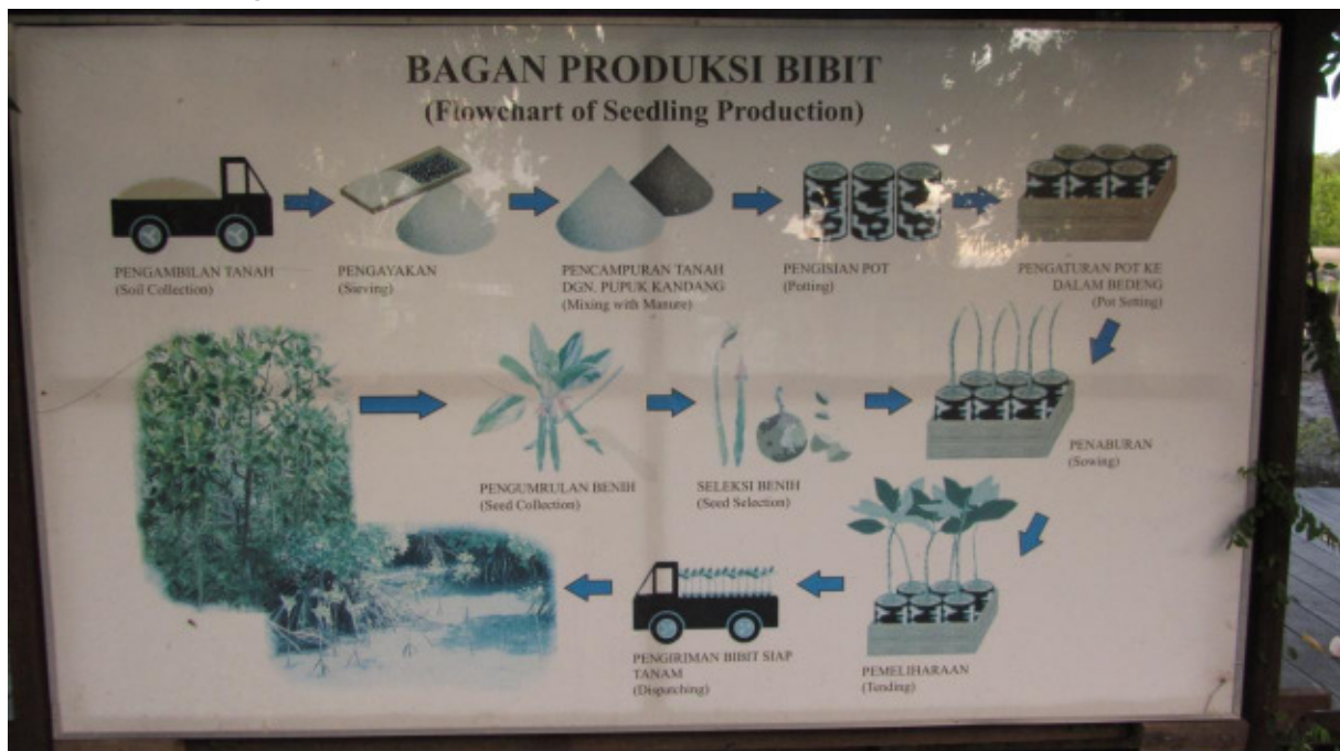
Informationstafel zur Mangrovenanzucht

gesamte Abfall bleibt zwischen ihnen hängen! Dadurch wird leider ein Schatten auf den ansonsten sehr schönen Park geworfen.