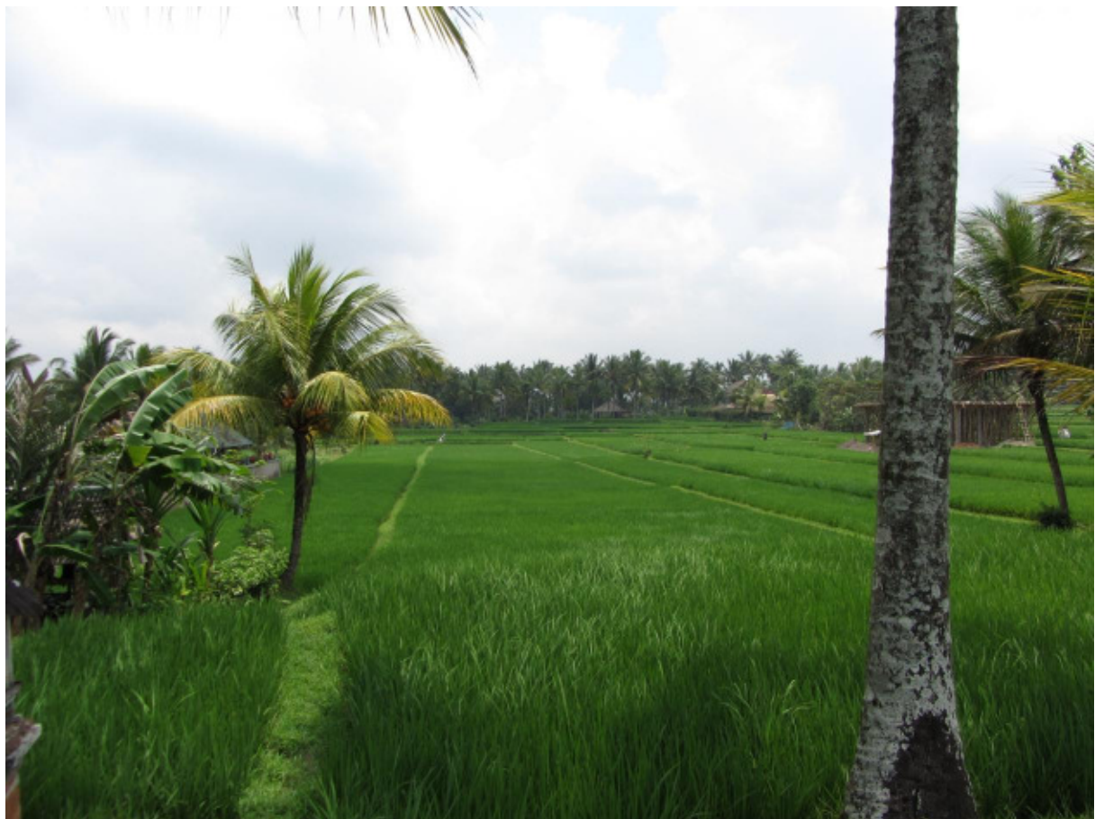
Reisfelder in Ubud

In Ubud hatte ich die Gelegenheit mit einem Bauern auf dem Weg durch eines der vielen Reisfelder zu sprechen. Ich fragte ihn, wie der Reisanbau in dieser Gegend funktioniert. Der Reis braucht drei Monate und eine Woche vom Pflanzen bis zum Ernten. Da es keine Jahreszeiten gibt, kann es somit