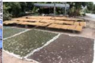
Trocknung von Tabak und Pfeffer