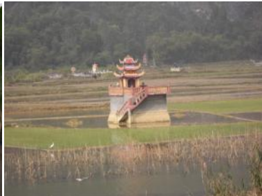
Grabstätte im Reisfeld

Weiter ging es in traditionell geflochtenen Ruderbooten entlang des Ngo Dong Flusses, wo wir viele Wasserpflanzen entdeckten, die bei uns im Aquarium kultiviert werden (Rotala, Limnophila, Potamogeton ....)