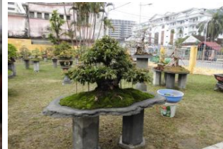
Verbotene Stadt - Weltkulturerbe