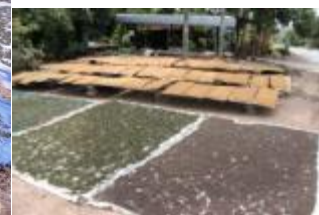
Trocknung von Tabak und Pfeffer